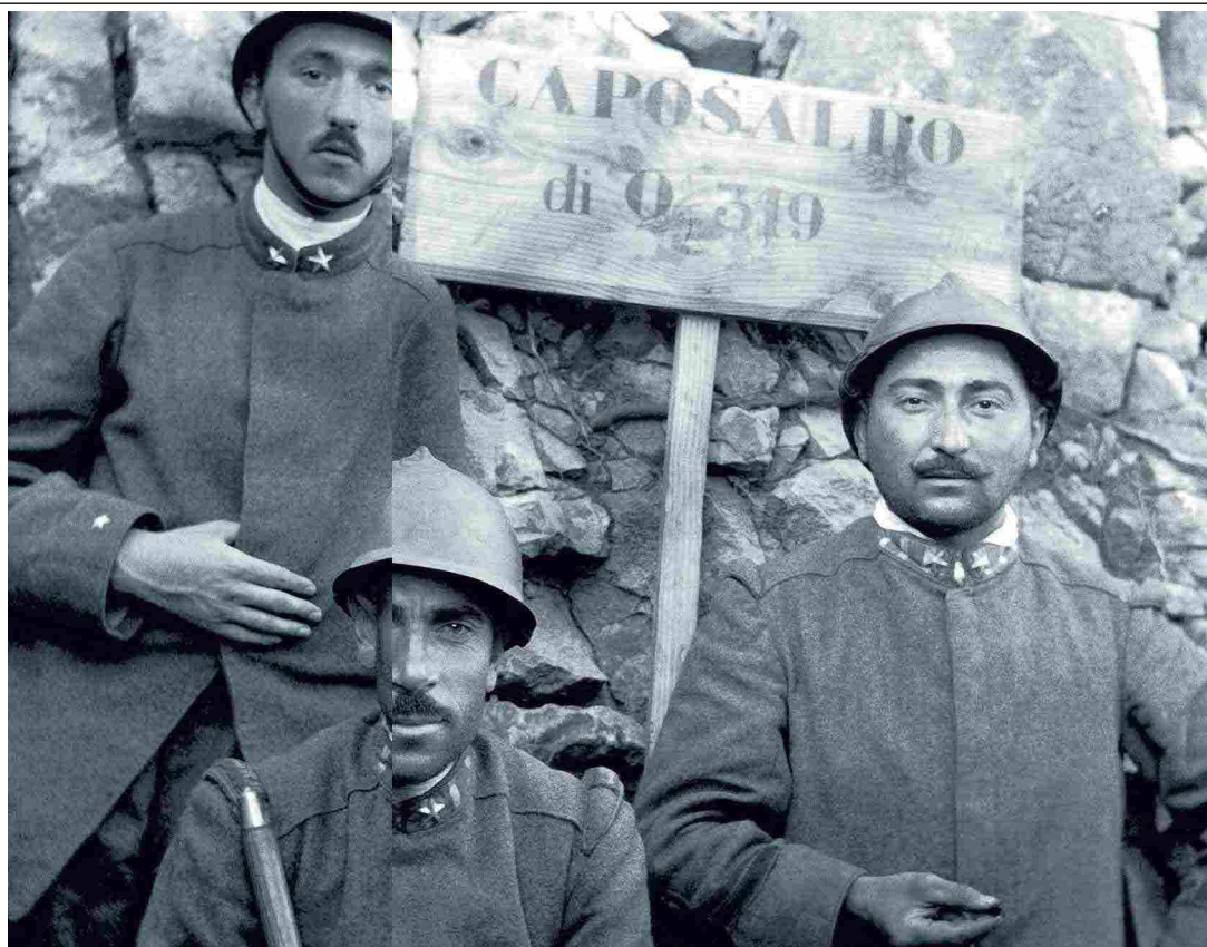
Carlo Emilio Gadda (primo a sinistra) al fronte; nell'immagine a destra una pagina autografa del «Giornale di guerra e prigionia»