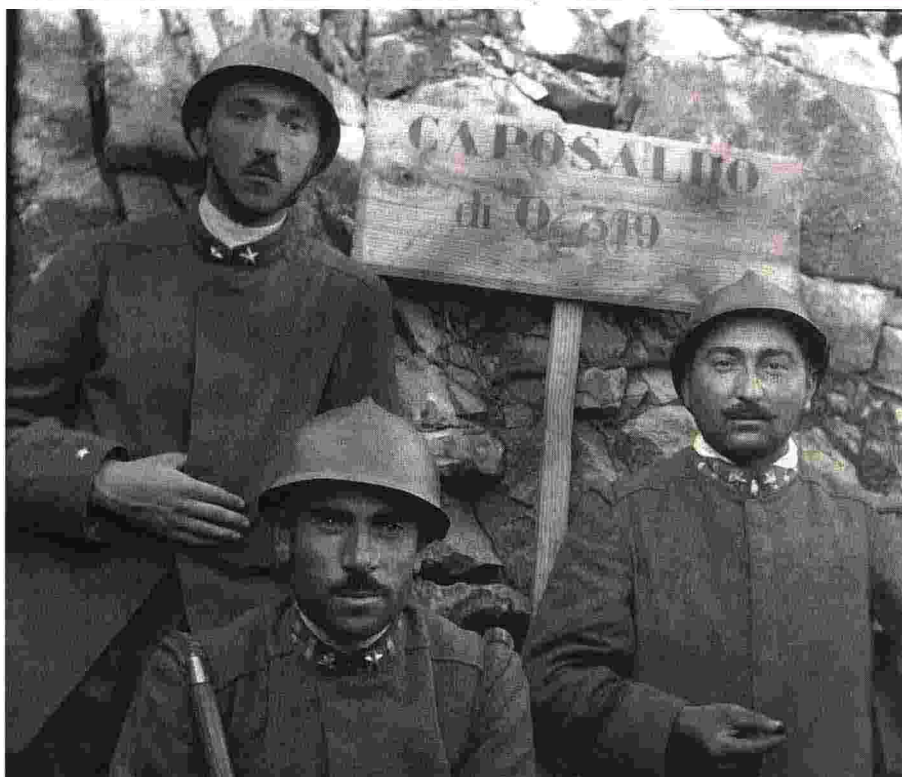
Carlo Emilio Gadda (1893-1973), il primo in piedi a sinistra, durante la Grande guerra con alcuni commilitoni in un centro di resistenza